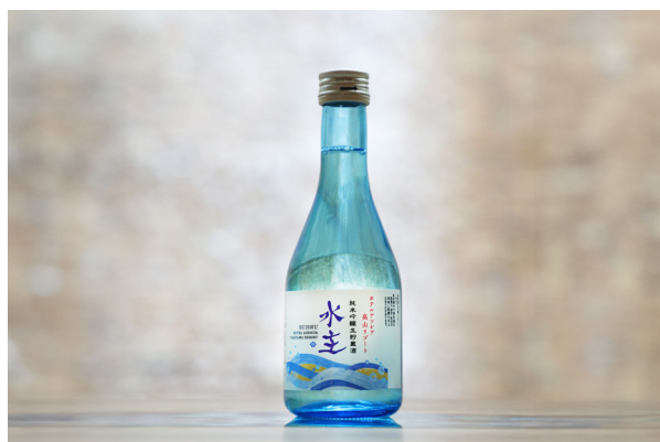
◆ 水主 ~ ホテルオリジナル日本酒 ~ (300ml/BTL) SUISHU ~Hotel Original SAKE~ ¥2,000