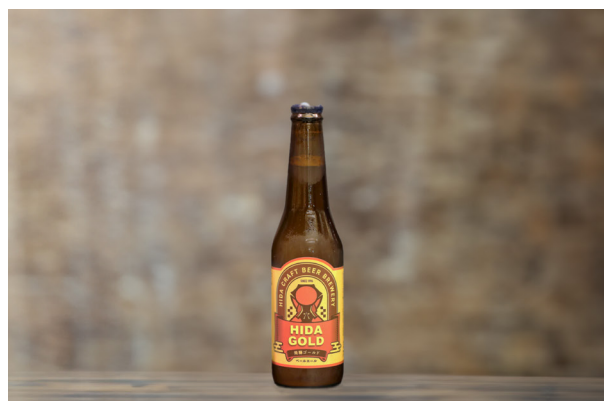
◆ 飛騨クラフトビールゴールド (330ml) HIDA Craft Beer ~GOLD~ ¥2,000