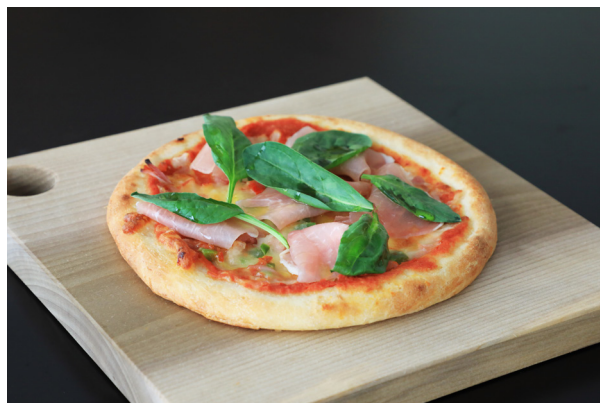
◆ ミックスピザ ¥2,400 Combination Pizza