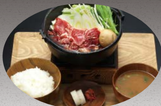
飛騨牛すき煮鍋御膳 HIDA-Beef Sukini Gozen ¥2,800