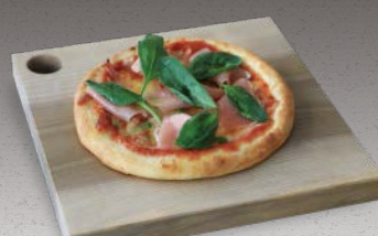
ミックスピザ ¥1,550 Combination Pizza