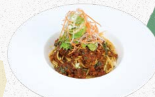
大豆ミートの ボロネーズパスタ Bolognese pasta with Soy meat ¥1,550