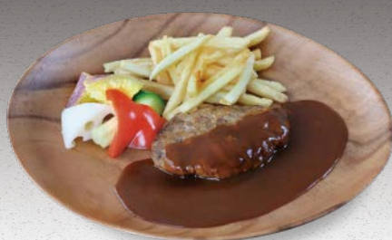
飛騨牛入りハンバーグ Hamburg Steak with Hida Beef

お食事をご注文いただいていないお客様は対象外となります。 Not applicable for customers who have not ordered a meal.