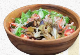
地元野菜とキノコの サラダパスタ Local Vegetables and mushroom pasta ¥1,550