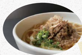
飛騨牛肉うどん HIDA-Beef Udon ¥1,600