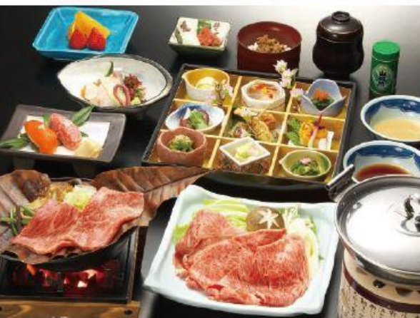
飛騨牛づくし御膳イメージ

飛騨で生まれた地酒とともに、料理長が飛騨の食材をふんだんに使って仕上げた「地産地消 飛騨の郷」やA5等級の飛騨牛を4種のお料理でお楽しみいただける「飛騨牛づくし御膳」などをご用意しております。