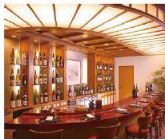
《パークウイング2階》日本料理 華雲内