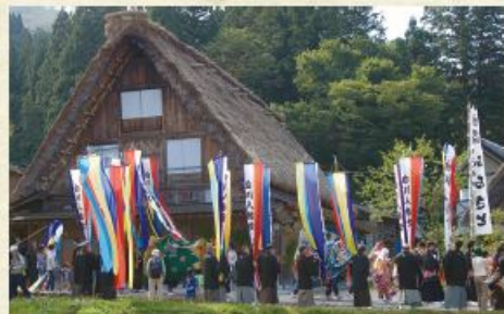
今年の開催は未定です。

1300年以上の歴史があり、五穀豊穡、家内安全、里の平和を山の神様に祈願する祭です。白川郷ならではの御神幸、獅子舞、民謡や舞踏などの神事が披露され、名前の通り、「どぶろく」が人々にあるまわられるのが最大の特徴です。