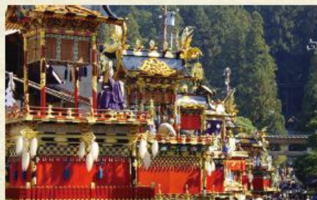
宵祭は提灯を灯した屋台が町を回り、昼とは異なる情景に。

毎年10月9日、10日に開催される高山祭は、日本三大美祭の一つに数えられ、ユネスコ無形文化遺産にも登録されています。見どころは、豪華絢爛な屋台と巧みな動きを披露するからくり人形。巧みな動きをするからくり人形には圧倒されます。