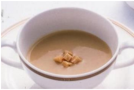
クリームコーンスープ