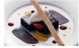
ケーキと バニラアイスクリーム