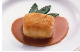
蟹肉を包んだ舌平目 チェスターフィールド風