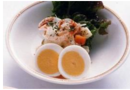
ポテトサラダ ゆで卵添え