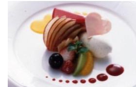
ケーキと バニラアイスクリーム