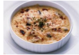
カレー風味 蟹のドリア