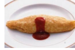
ホテル特製オムライス