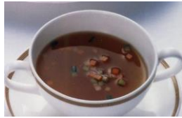
チキンコンソメスープ 小野菜入り