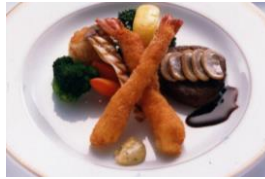
牛フィレ肉のステーキと 海老フライの盛り合わせ