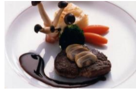
牛フィレ肉のステーキ マッシュルームソース