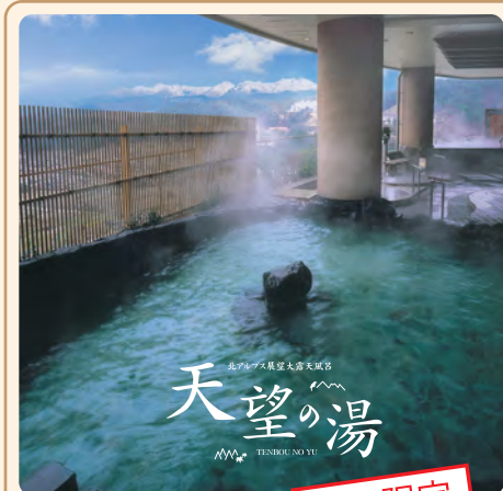
北アルプス展望露天風呂 天望の湯 TENBO NO YU