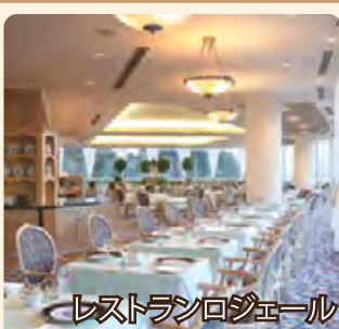
レストランロジェール